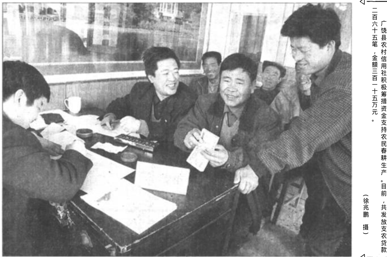
广饶县农村信用社积极筹措资金支持农民春耕生产。目前，共发放支农贷款二百六十五笔，金额三百一十五万元。