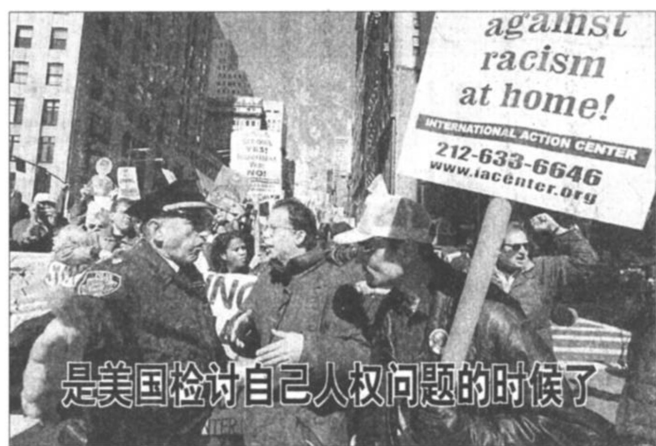
是美国检讨自己人权问题的时候了

5月3日，美国在联合国人权委员会改选中落选，失去其保持半个多世纪的联合国人权委员会成员国席位，在国际社会引起强烈反响。美国一直以人权作幌子，推行霸权主义，而其国内的人权问题却在不断恶化，种族歧视、警察暴力、校园枪杀等现象层出不穷，已经成为严重的社会问题。现在是美国检讨自己人权问题的时候了。图为要求消除种族歧视的示威者受到警察阻挠。